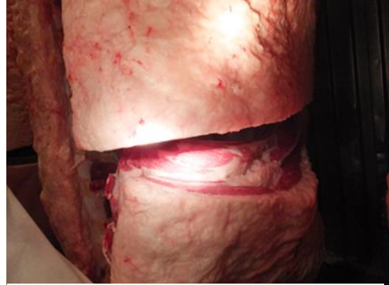
受賞した枝肉のカット断面